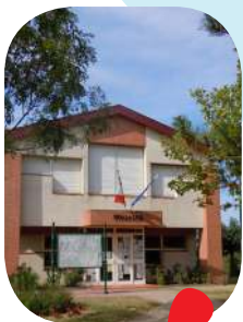
vie municipale p.2

Mairie de Deyme 11 route de pompertuzat 31 450 Deyme Tel. : 05 61 81 71 93 Fax. : 05 61 81 37 59 Mail. : accueil@deyme.fr Horaires d'ouverture