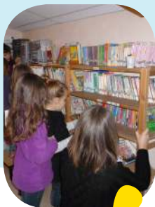
vie scolaire p.5