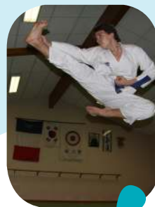
vie associative p.6