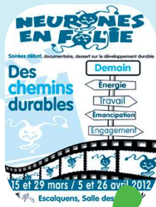
vie intercommunale p.3